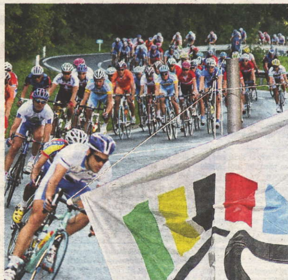
Starter aus 58 verschiedenen Nationen radelten um den Weltmeistertitel.