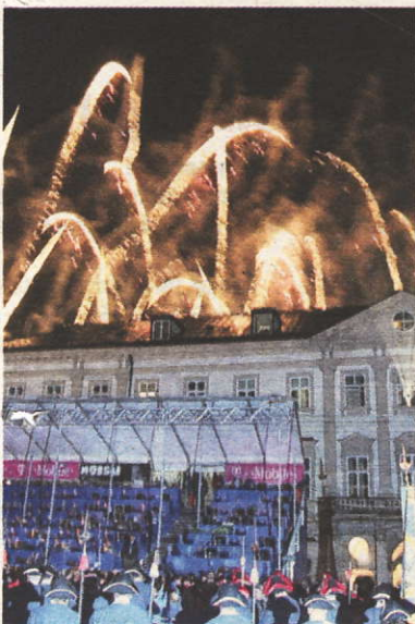
Feuerwerk zur Eröffnung der Rad-WM: Hinter dem Schloss Mirabell sprühten die Funken.