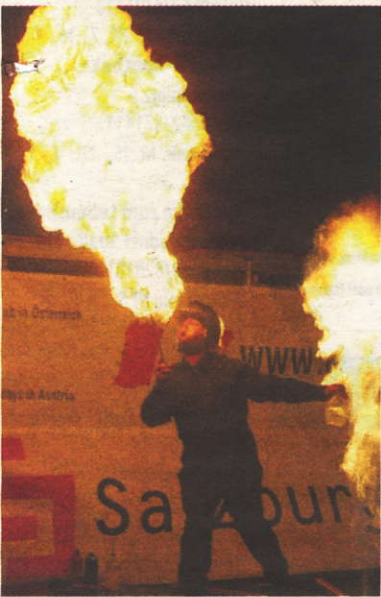
Ein Feuerschlucker sorgte für zusätzliches Knistern bei der Eröffnungszeremonie.