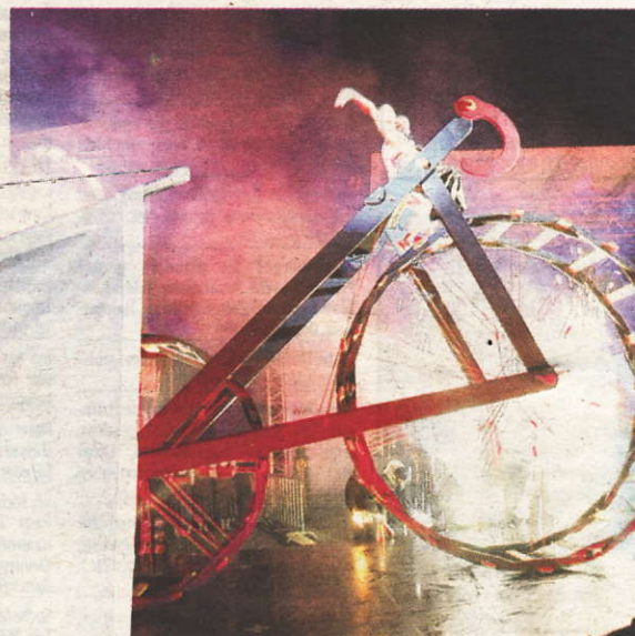
Mit einer fulminanten Showeinlage wurde die Rad-WM am Dienstag vor einer Woche in Salzburg eröffnet.