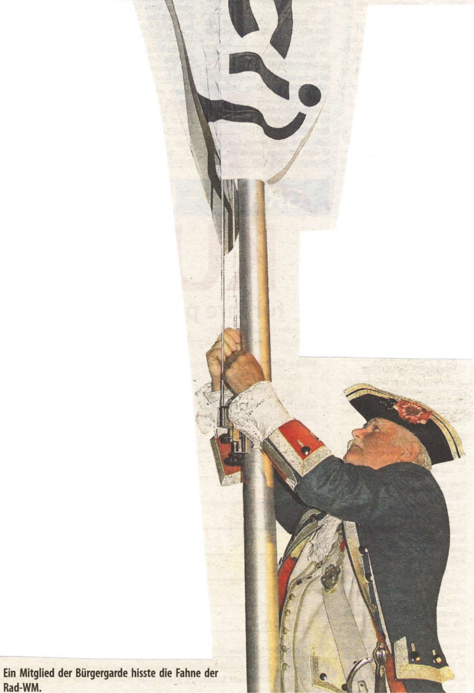
Ein Mitglied der Bürgergarde hisste die Fahne der Rad-WM.