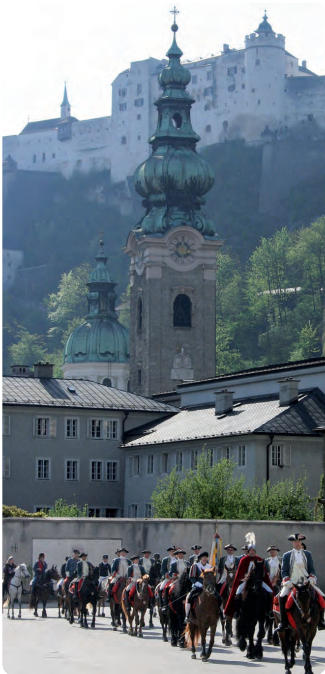
Georgi-Ritt auf die Festung Hohensalzburg