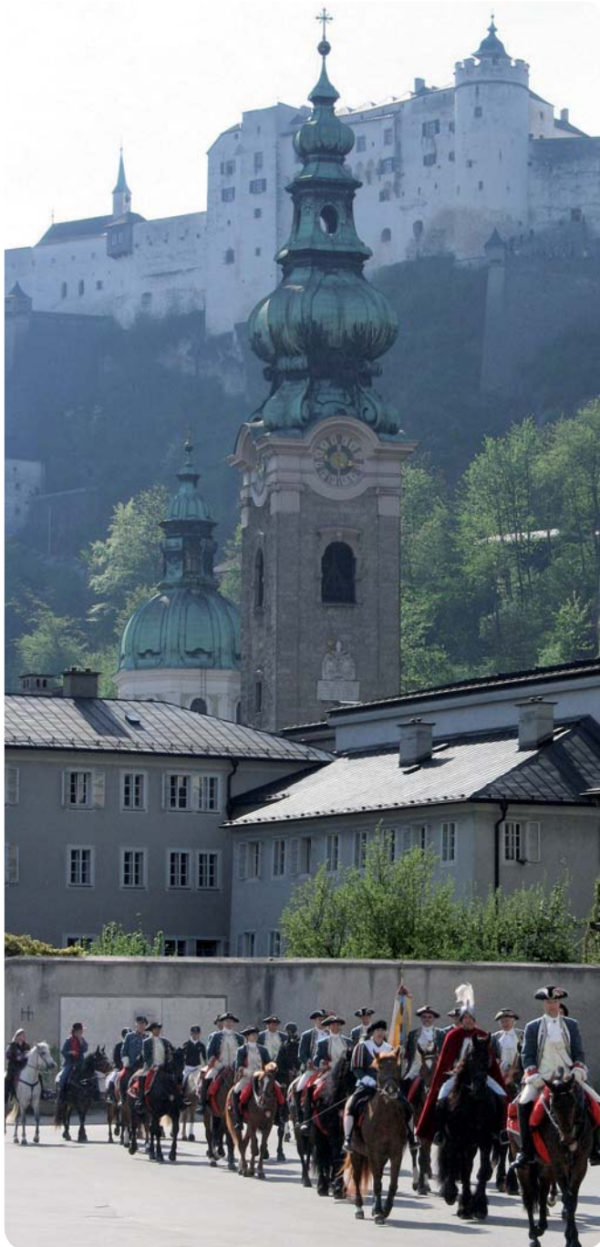
Georgi-Ritt auf die Festung Hohensalzburg