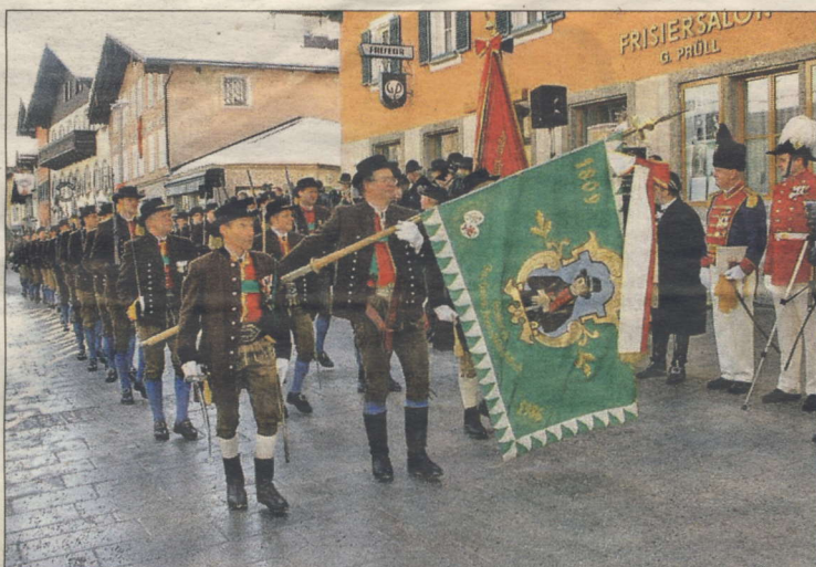
Aufmarsch des Struberschützenkorps Werfen.

Bereits im Jahr 1800 und 1805 drangen französische Bataillone bis nach Werfen vor. Das Stegenwald-Gut und die umliegenden Gehöfte waren durch Plünderungen der fremden Soldaten immer wieder in Mitleidenschaft gezogen worden. Als im September 1809 die napoleonischen Truppen erneut vorrückten, entschloss sich Struber zum Widerstand. Mit 400 Freiheitskämpfern bezwang der Schützenkommandant in tagelangen